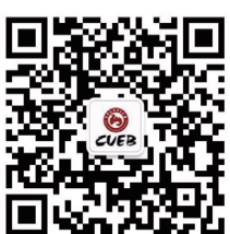
首都经济贸易大学 官方企业号