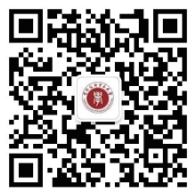
首经贸学生工作部 (处)