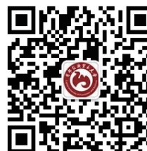
首都经济贸易大学 官方公众号