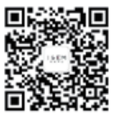
国际经济 管理学院