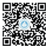
城市经济与 公共管理学院