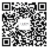
国际经济 管理学院