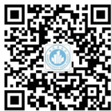
城市经济与 公共管理学院