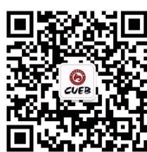
首都经济贸易大学 官方企业号