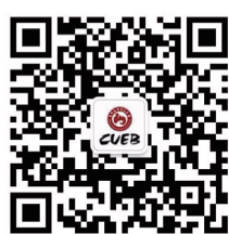
首都经济贸易大学 官方企业号